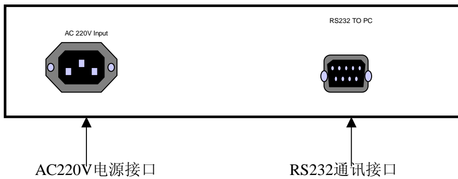
LK-01PLUS后面板接口示意图